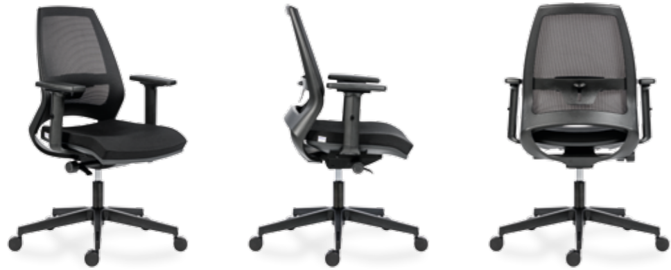
1770 SYN INFINITY NET ECO +BR 16