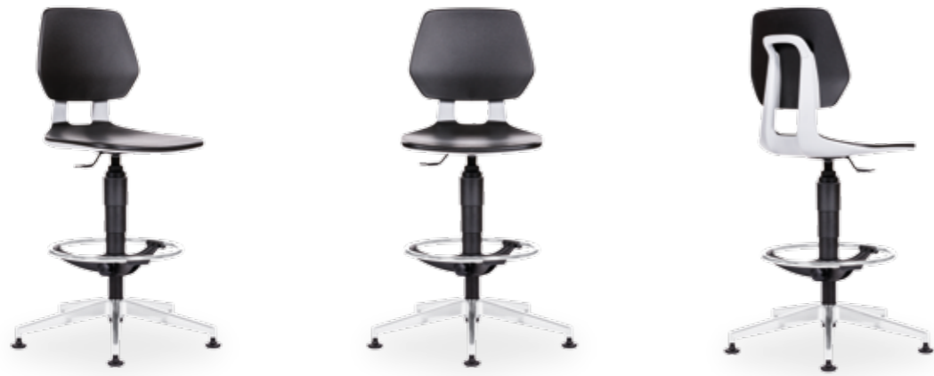
1260 ALLOY PLAST ALU +EXTEND v.n., KL.