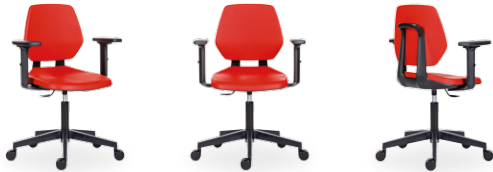
1260 ALLOY PU +BR 16