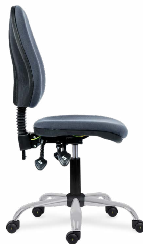
1040 MEK ERGO C ANTISTATIC (ESD) STANDARD